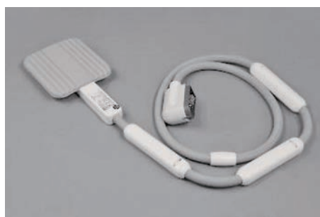
図2 ^{23}\text{Na} -MRI用のflex coil