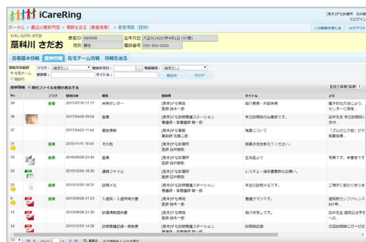
患者情報共有画面

5) 標準化への対応状況、未達成の場合対応予定および対応のための追加費用の有無：